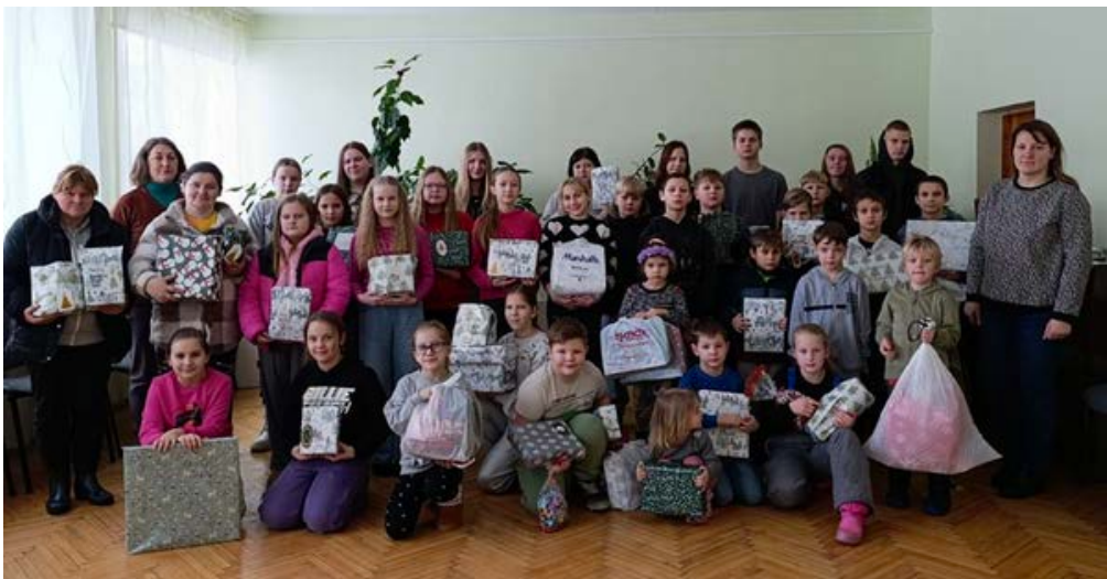
Aizputes draudzes bērni ar dāvanām 2025. gada decembrī.