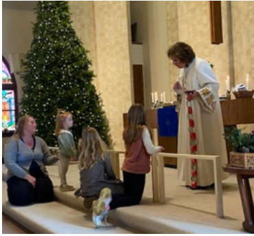
Paldies Draudzes bērniem kuri ar savu Adventa projektu paši nodomāja noziedot sakrāto naudu Humane Animal Welfare Society!

Dear Children ~ Thank you so much for donating your Advent gift to HAWS. What a thoughtful and generous thing to do! The animals are super happy for your support. From all of the people and animals at HAWS - Thank you and may the love of Jesus continue to shine in your hearts throughout 2026! Blessings, Monica